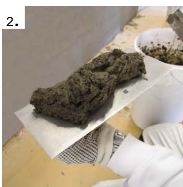
Fyll brettet med egnet flislim,