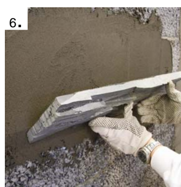
Steinpanelen presses godt inn i flislimet.