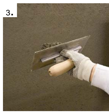
Flislimet trekkes på veggen med brett.