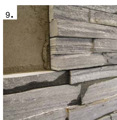
Legg neste steinpanel forbandt.