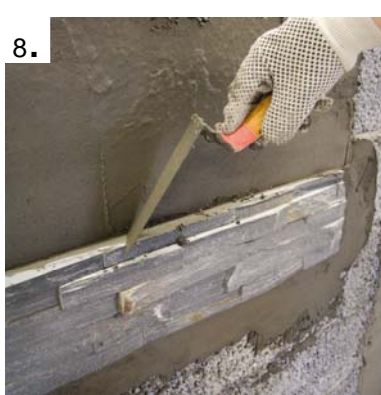
Overskudd fjernes fortløpende.