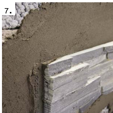
Steinpanelen skal ikke fuges.